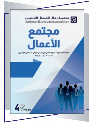
الإصدار الأول من مجلة مجتمع الأعمال لعام 2025