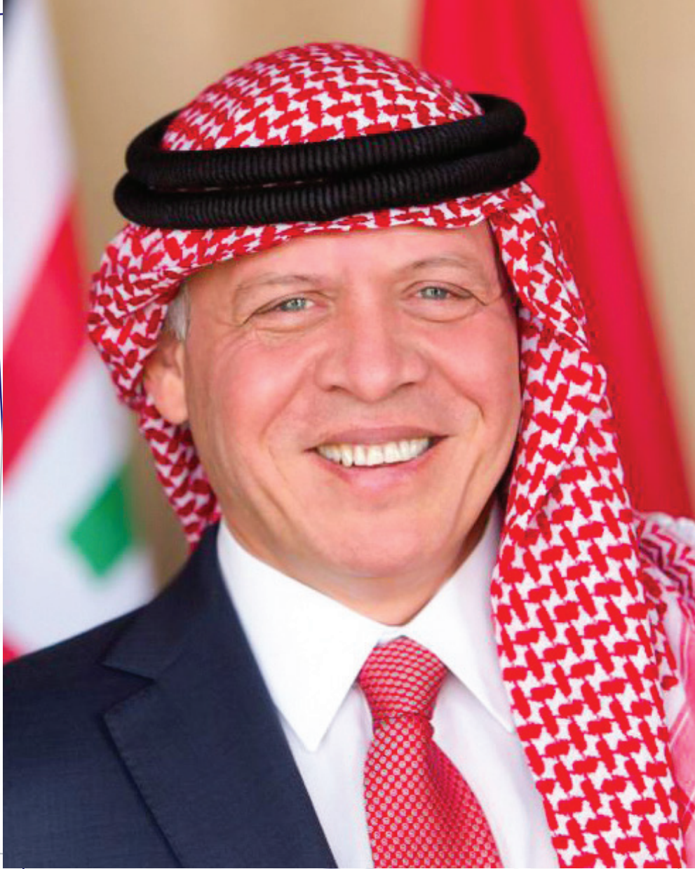
حضرة صاحب الجلالة الهاشمية الملك عبد الله الثاني ابن الحسين المعظم