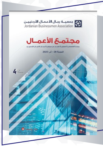
الإصدار الثاني من مجلة مجتمع الأعمال لعام 2025

أصدرت جمعية رجال الأعمال الأردنيين ثلاثة أعداد من مجلة مجتمع الأعمال التي تضمنت أبرز نشاطات وإنجازات الجمعية خلال عام 2025 بالإضافة إلى إصدار دليل الأعضاء باللغتين العربية والإنجليزية.