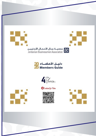
دليل أعضاء الجمعية 2026