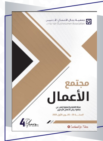
الإصدار الثالث من مجلة مجتمع الأعمال لعام 2025