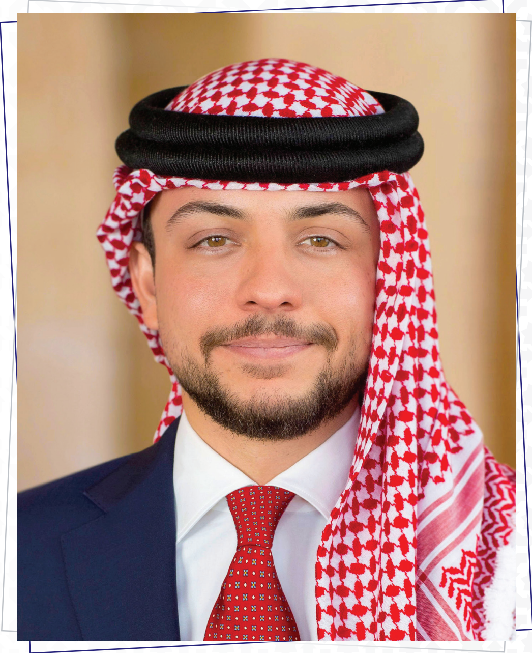
صاحب السمو الملكي الأمير حسين بن عبد الله ولي العهد المعظم