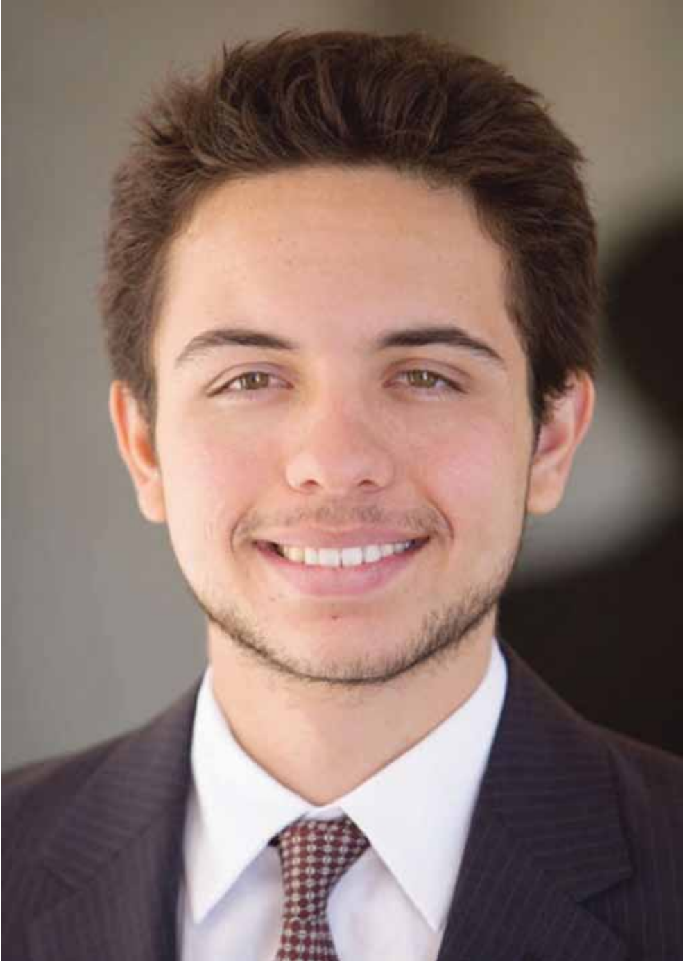
حضرة صاحب السمو الملكي الأمير الحسين بن عبدالله الثاني المعظم ولي العهد