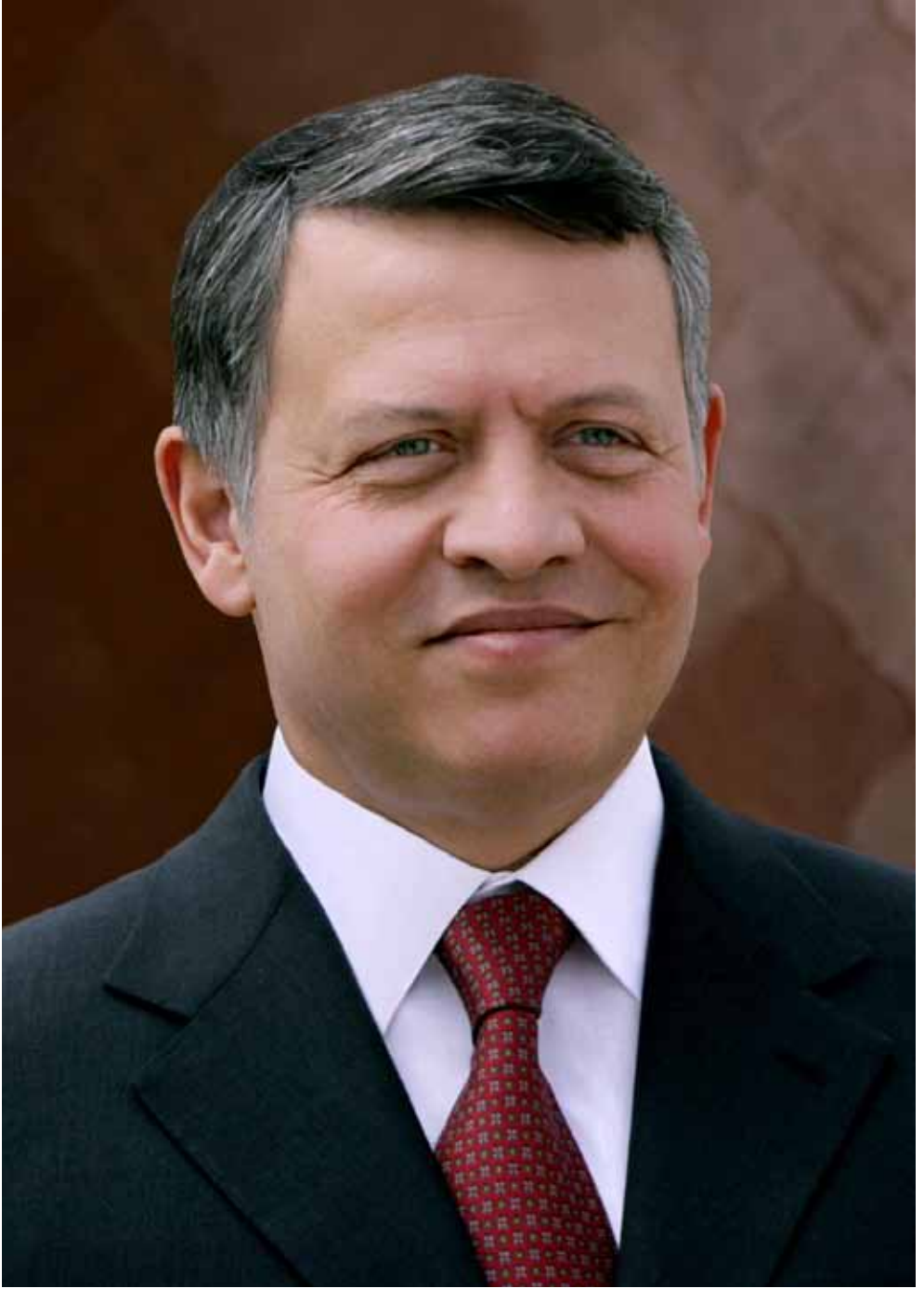
حضرة صاحب الجلالة الهاشمية الملك عبدالله الثاني ابن الحسين المعظم حفظه الله