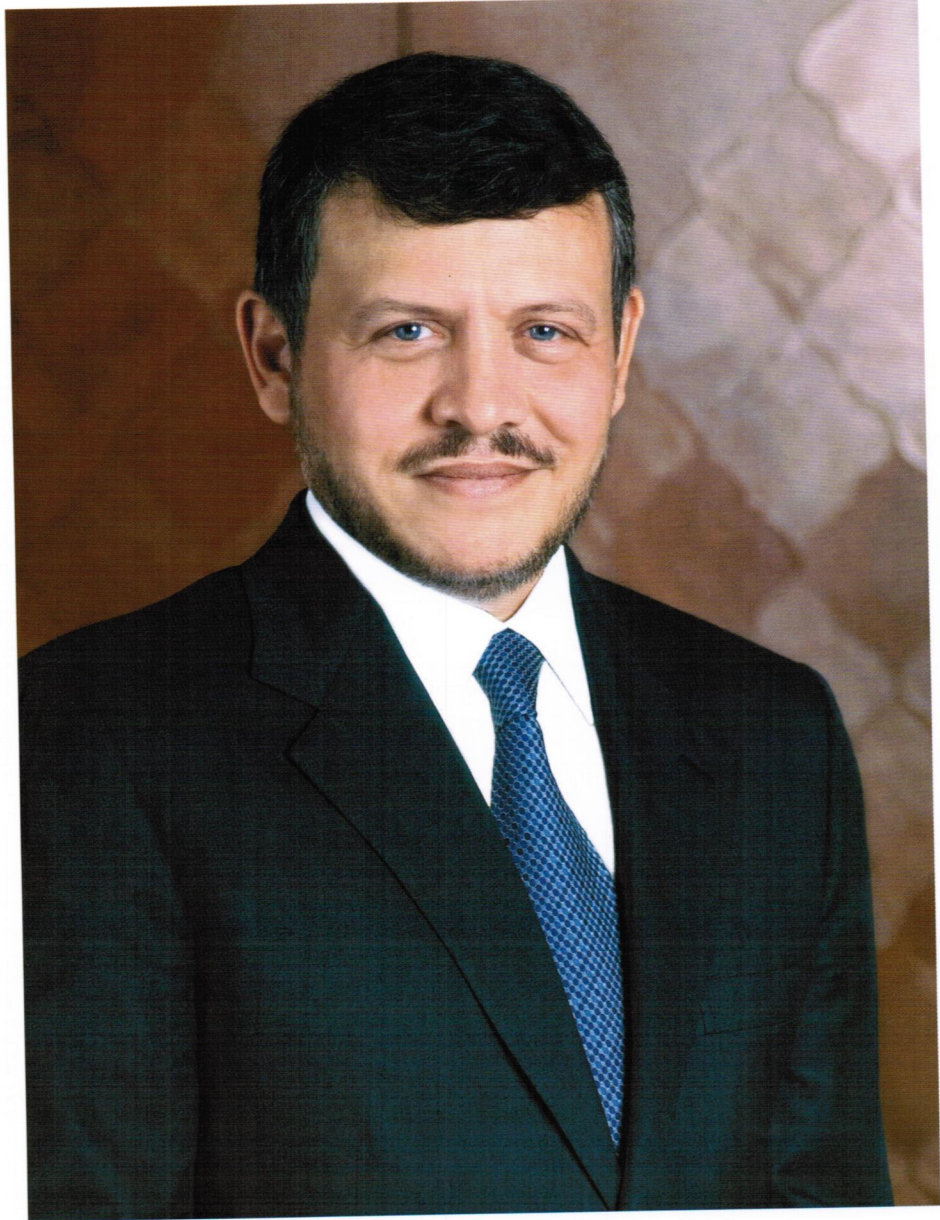
صاحب الجلالة الملك عبدالله الثاني المعظم