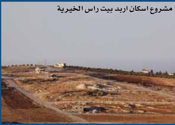
مشروع اسكان اربد بيت راس الخيرية