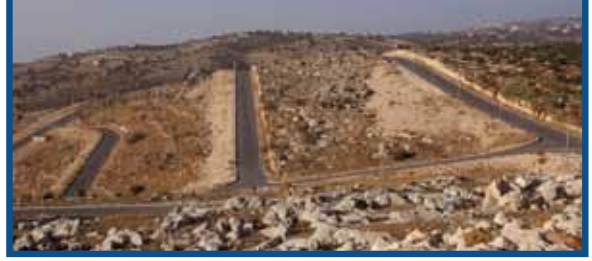
مشروع اسكان السلط بطنا زينة البلقاء