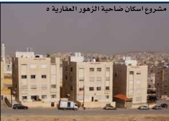
مشروع اسكان ضاحية الزهور العقارية ه