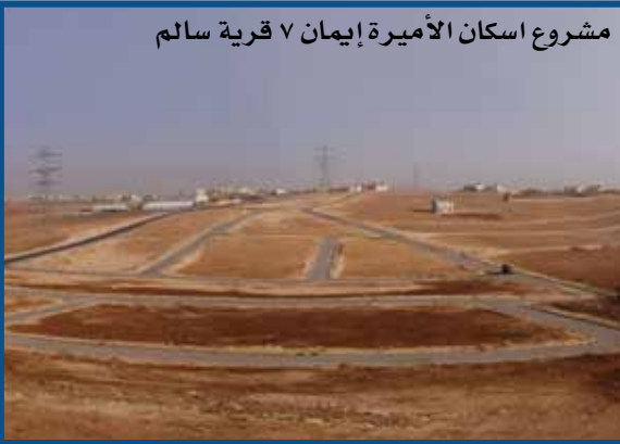
مشروع اسكان الأميرة إيمان ٧ قرية سالم