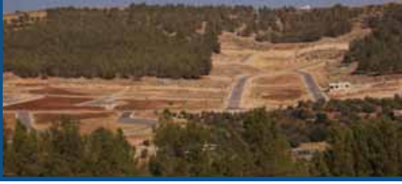
مشروع اسكان جرش الكته منطقة الجبارات