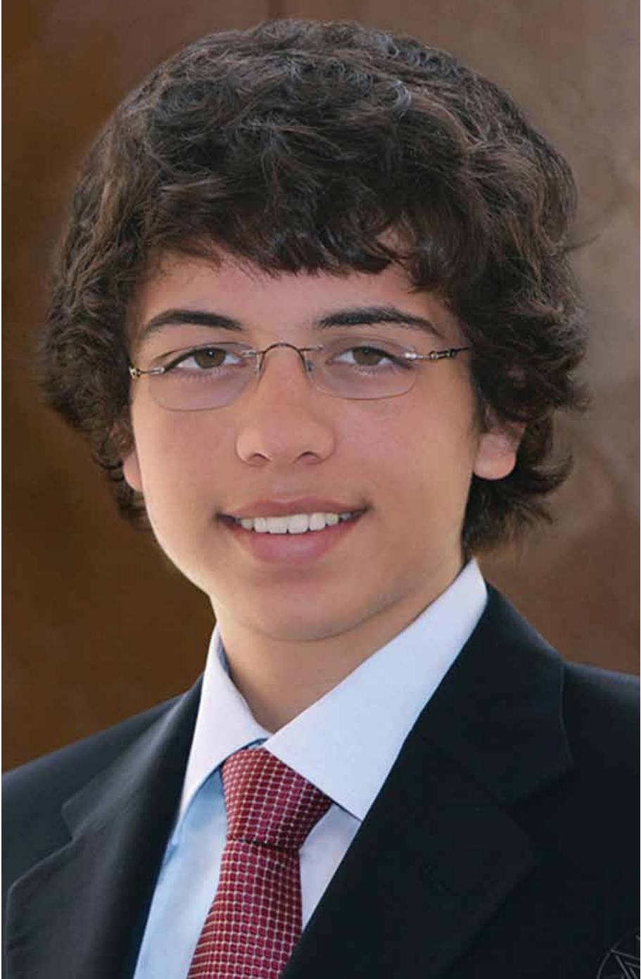
صاحب السمو الملكي الأمير الحسين بن عبد الله الثاني ولي العهد المعظم