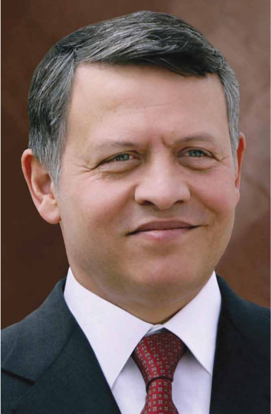
صاحب الجلالة الهاشمية الملك عبد الله الثاني ابن الحسين المعظم