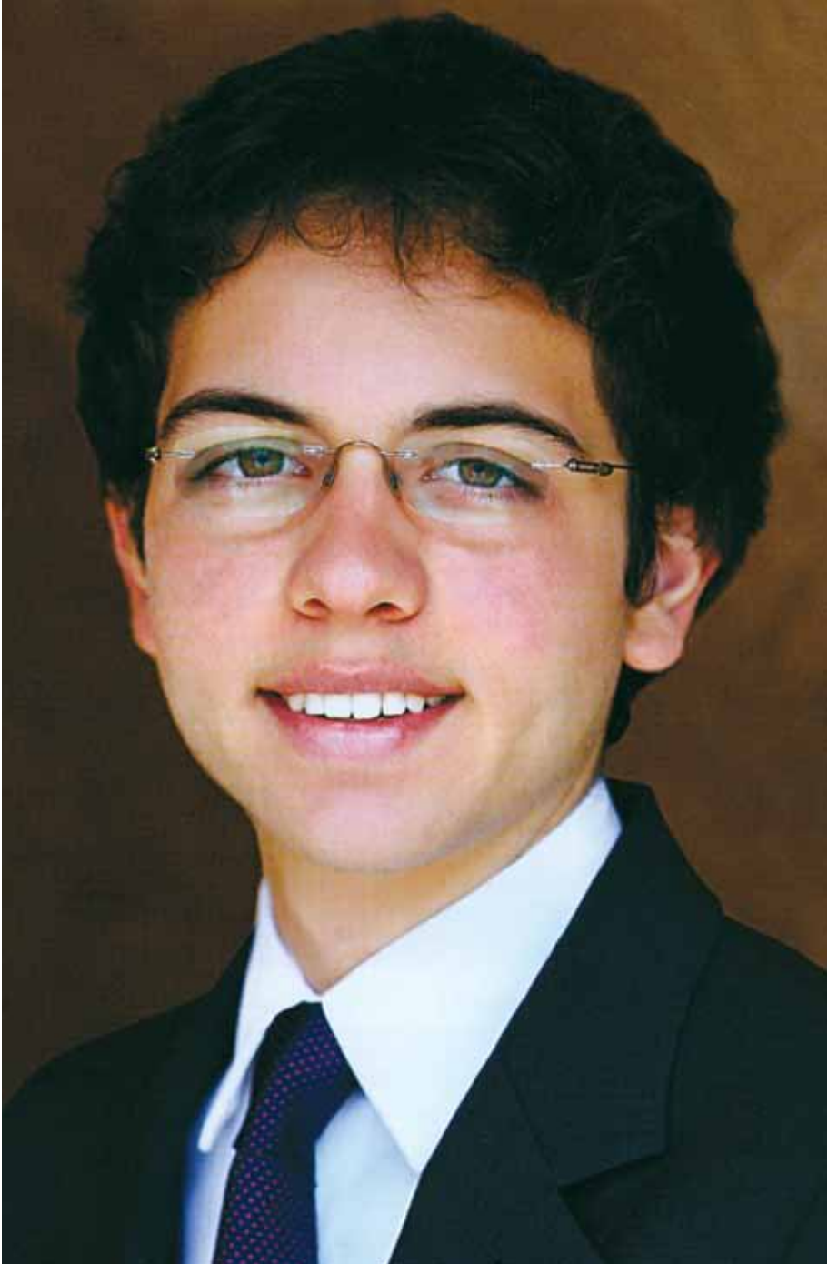
صاحب السمو الملكي الأمير الحسين بن عبد الله الثاني ولي العهد المعظم