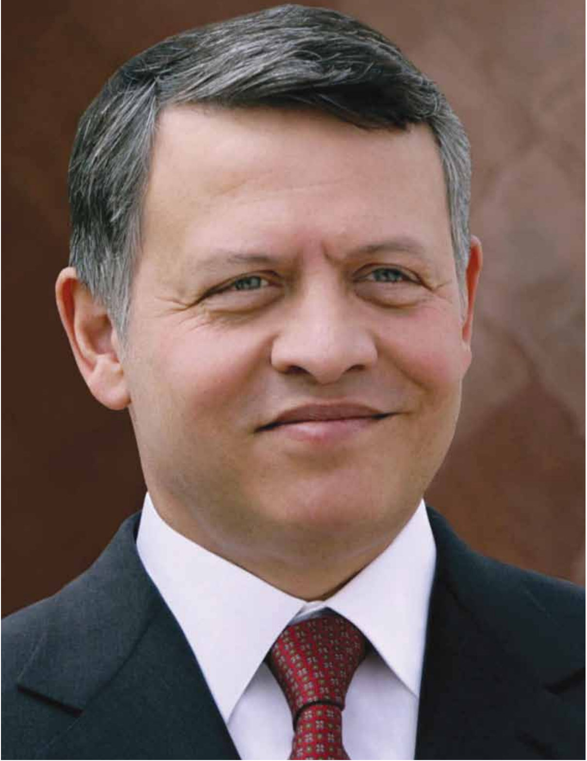
حضرة صاحب الجلالة الهاشمية الملك عبدالله الثاني ابن الحسين المعظم