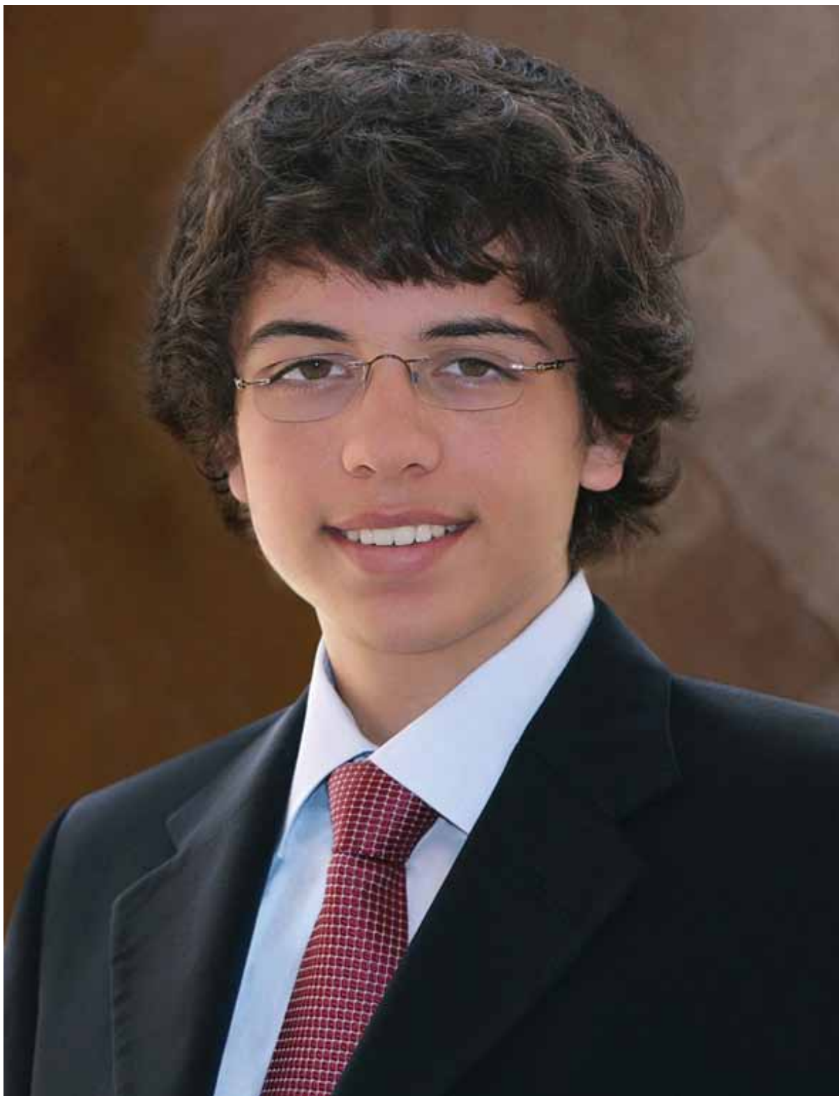
صاحب السمو الملكي الأمير حسين بن عبدالله ولي العهد المعظم